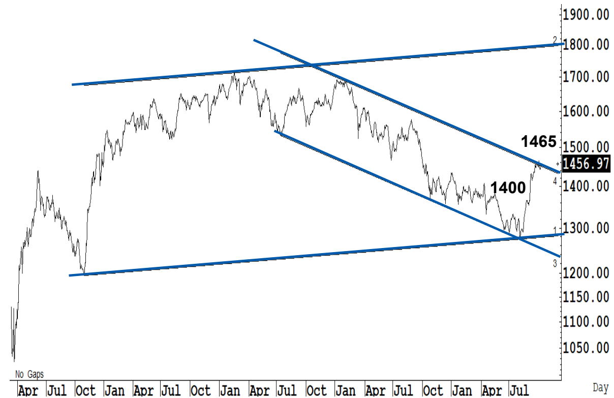
Figure 1 : SET Index daily chart